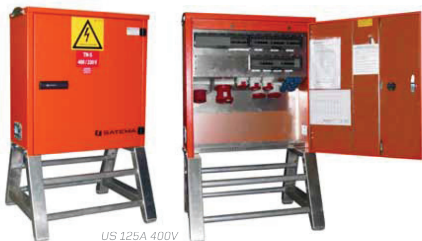
US 125A 400V