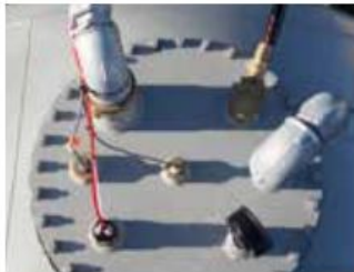
Mannlukk for tilkobling (dobbel vegg)