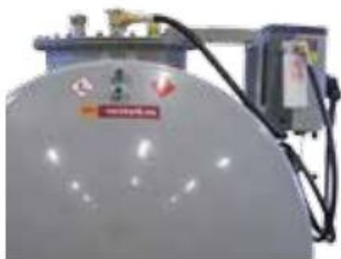
Brakett for pumpe på mannlukk