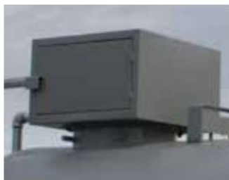
Låsbar hette for mannlukk