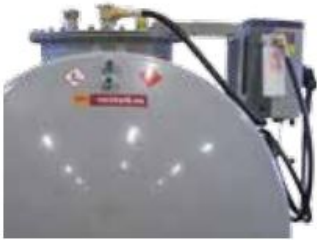
Brakett for pumpe på mannløkk