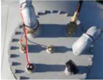
Mannløkk for tilkobling (dobbel vegg)