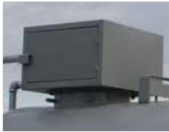
Låsbar hette for mannløkk