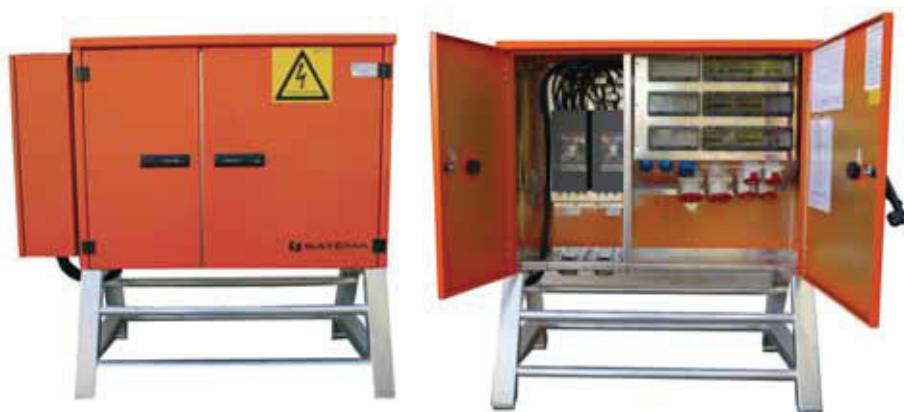
HS 250A 400V