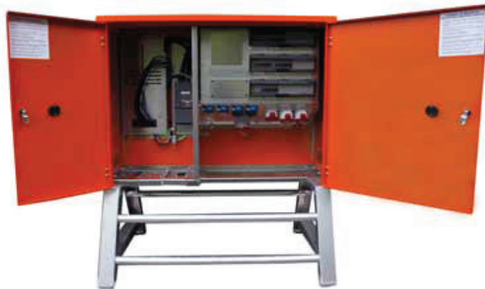
HS 125A/160A 400V