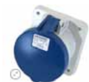
Stikkontakt – innfelt rett 363-9