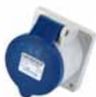
Stikkontakt – innfelt rett 332-9