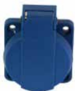
Stikkontakt innfelt 2/16+j (Schuko)