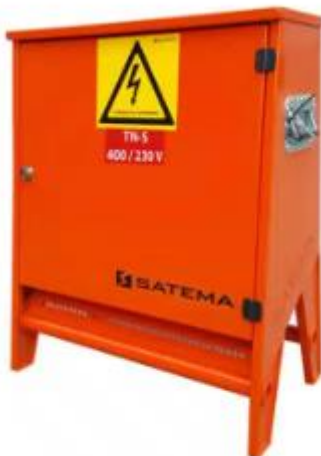
US 63A 400V m/ integrert stativ