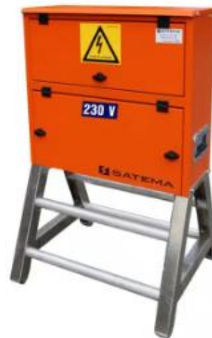
US 63A 230V m/ Alu-stativ