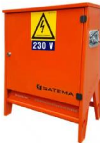
US 63A 230V m/ integrert stativ